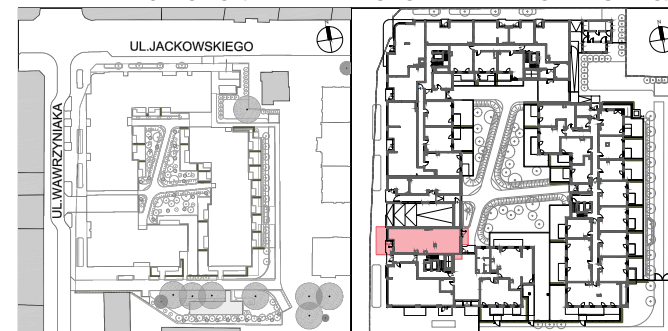
POŁOŻENIE NA KONDYGNACJI